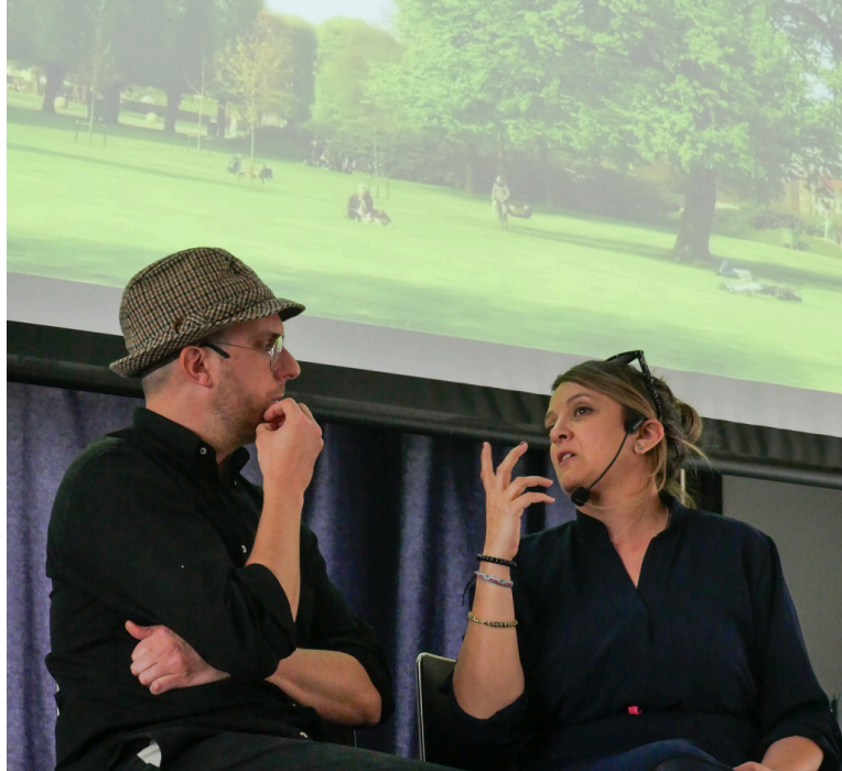
Gli attori di Teatroeducativo